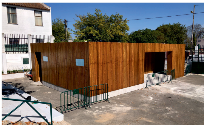
Escola de Segunda Oportunidade, em edifício construído no espaço da Junta de Freguesia no Campo das Amoreiras. Projeto e Obra da Freguesia de Santa Clara.