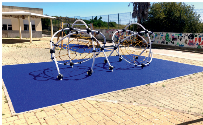
Espaço de Jogos e Recreio (Parque Infantil) - 1ºCiclo da Escola Pintor Almada Negreiros. Substituição do pavimento e cabos do equipamento e pinturas das estruturas.