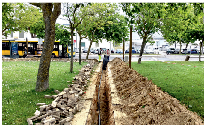
Implementação de um sistema de rega mais eficiente no Campo das Amoreiras. Execução da obra pela Junta de Freguesia.