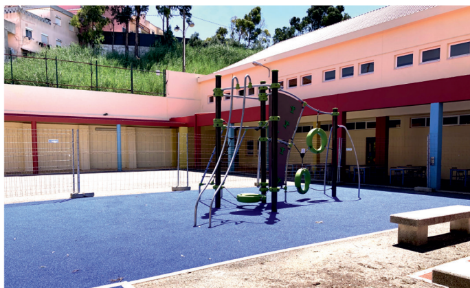
Espaço de Jogos e Recreio (Parque Infantil) - 1ºCiclo da Escola Maria da Luz de Deus Ramos. Requalificação e instalação de novo equipamento.